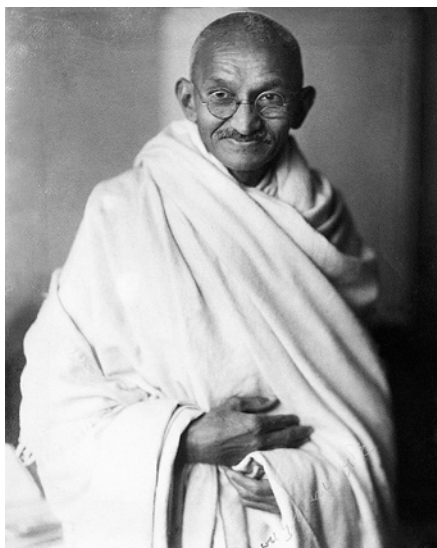
Mohandas Karamchand Gandhi (02. 10. 1869 – 30. 01. 1948)

Dejala je tudi, da je v kratkem času, odkar je v Sloveniji, med slovenskim prebivalstvom zaznala ljubezen in veliko spoštovanje do Gandhija in njegove filozofije, kar je ganljivo. Dejstvo, da je Gandhi pridobil vidno mesto v Slovenj Gradcu, ki so ga Združeni narodi razglasili za mesto Glasnik miru, in prevod njegove avtobiografije v slovenščino pričata o tem.